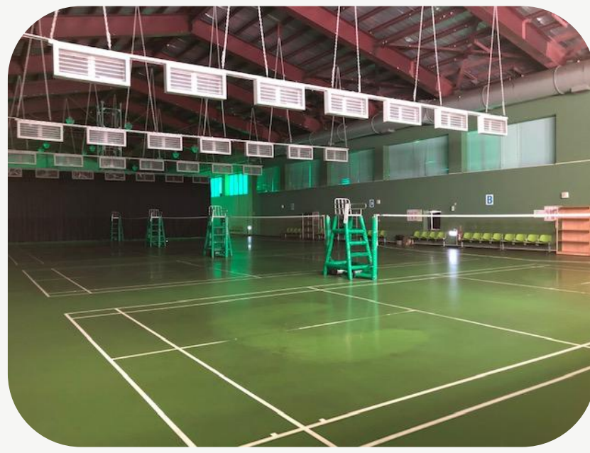
羽球場 排球場 籃球場